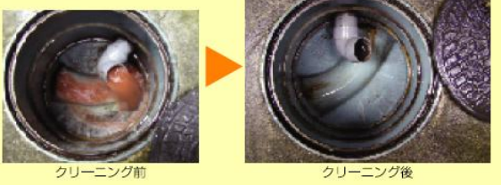
クリーニング前 クリーニング後

汚水樹の洗浄 汚水樹の洗浄はもちろんのこと、そこに至るまでの排水管の洗浄をすべて行っています。高圧洗浄機の長いパイプで、宅内の排水口から屋外の汚水樹まで洗浄します。